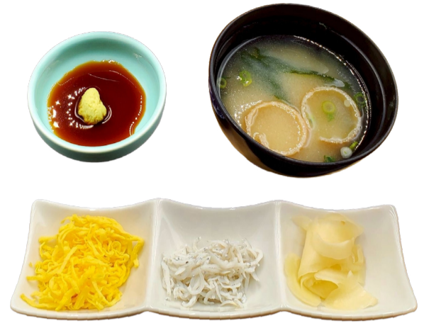
海鮮丼 (上) ※仕入状況により内容は変わることがあります。