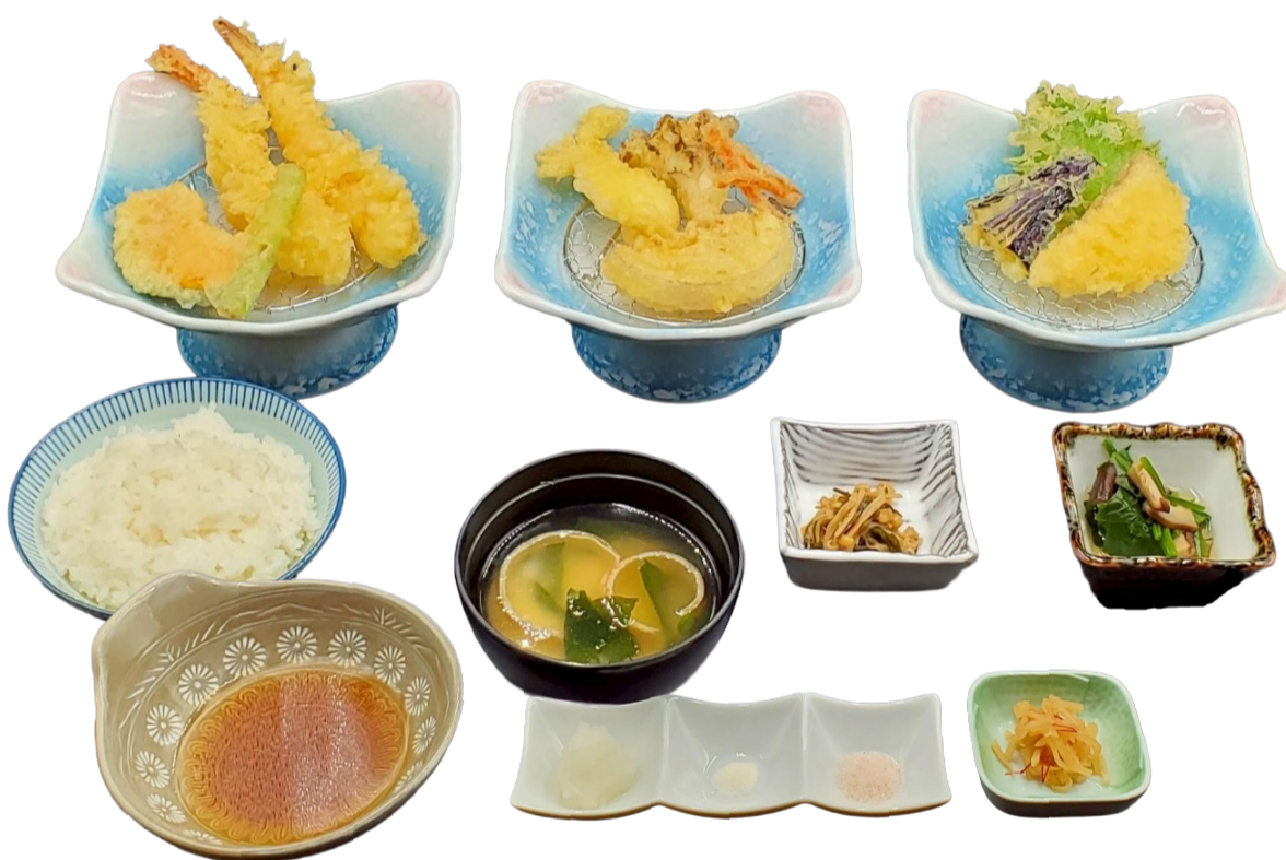
竹 (季節の揚げたて天ぷら 9品 / 小鉢 3品 / ご飯 / 味噌汁)