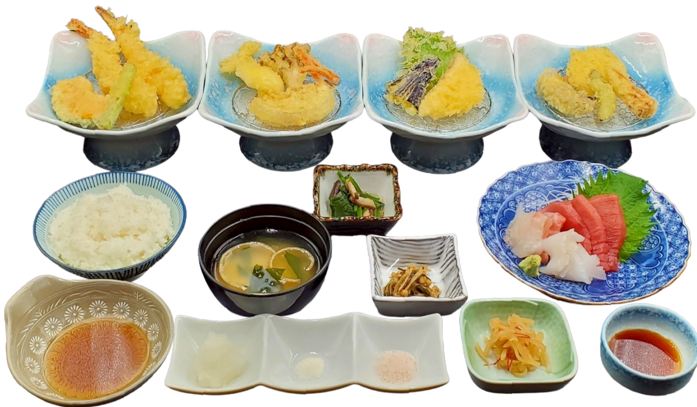
松 (季節の揚げたて天ぷら 12品 / お造り / 小鉢 3品 / ご飯 / 味噌汁)